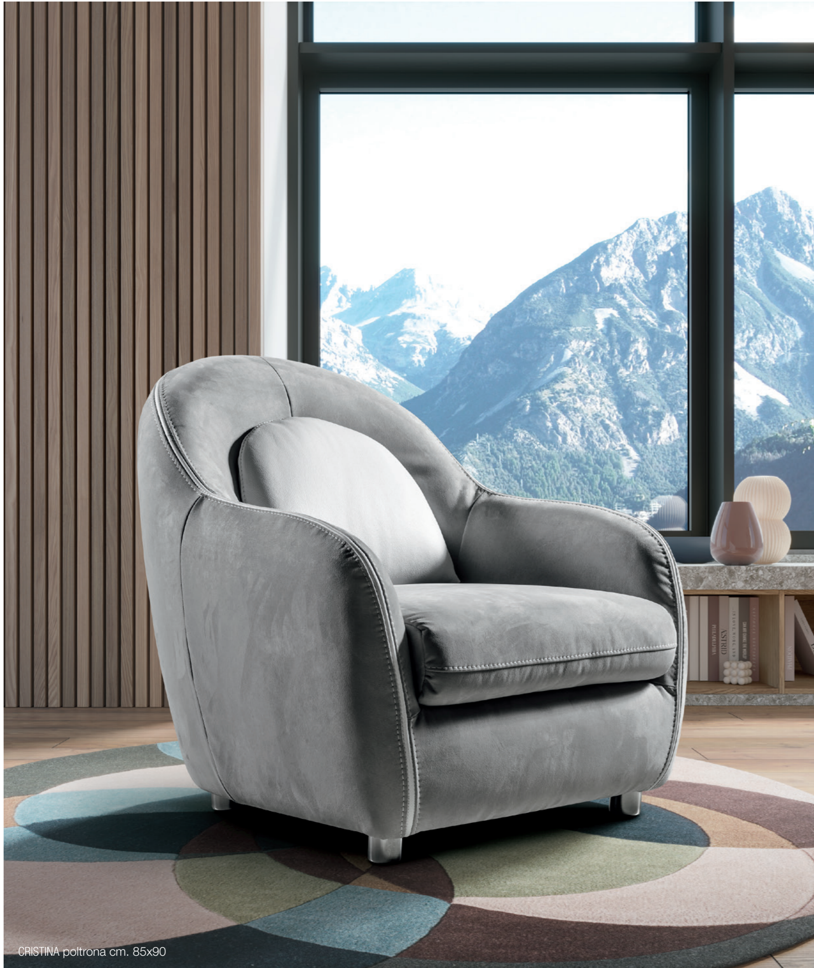
CRISTINA poltrona cm. 85x90